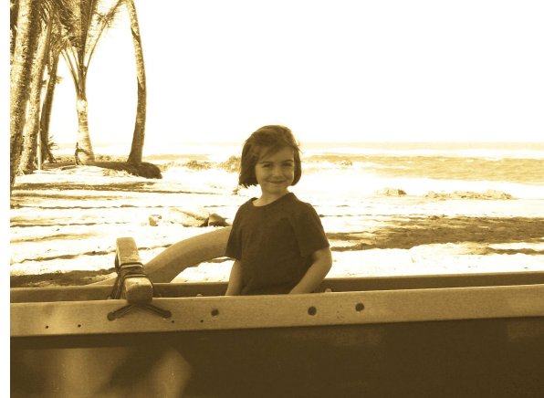
Foto con efecto envejecido